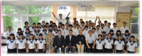
都路中学生たちと講師の方々