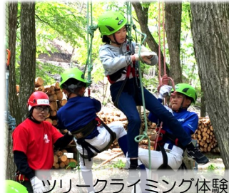
ツリークライミング体験