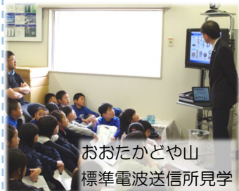
おおたかどや山 標準電波送信所見学