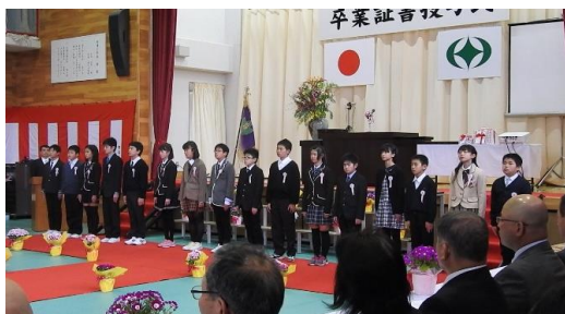
古道小学校の卒業生(16名)

3月23日、古道小学校と岩井沢小学校で卒業式が行われ、6年生が巣立っていきました。中学校でも勉強に部活に頑張ってください！(荒井)