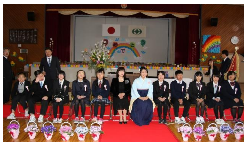
岩井沢小学校の卒業生(10名)