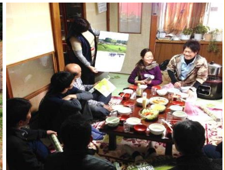
昼食を食べながら団らん