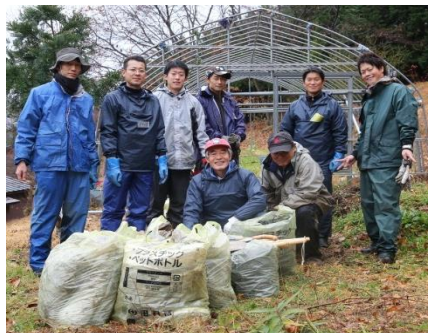
作業が終わって記念撮影

これからも、人と人との交流を大事にしながら、ボランティア作戦を続けていきますので、皆さまのご参加をお待ちしています。都路の皆さんも大歓迎です！(筏谷)